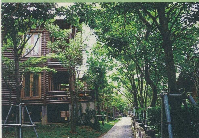
Rimbunan pepohon hijau menjadi sebahagian dari landskap yang cukup mengujakan di Philea Resort & Spa

kerana Philea Resort & Spa sentiasa memberikan kelainan kepada setiap pengunjung yang singah bermalam.