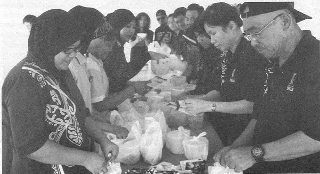
Kakitangan Philea Resort & Spa sedang membungkus bubur lambuk