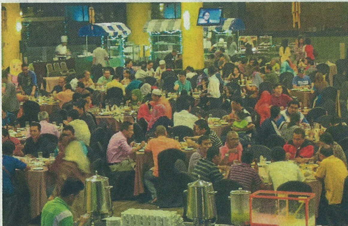
“斋戒月美味 388 自助餐” 深获各族的青睐。