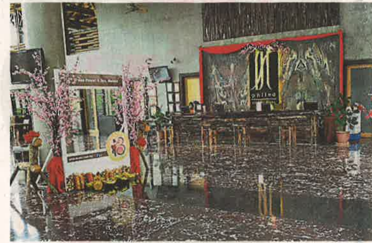
▲甲州酒店与民宿竞争激烈，不断进行各种促销刺激入住率。